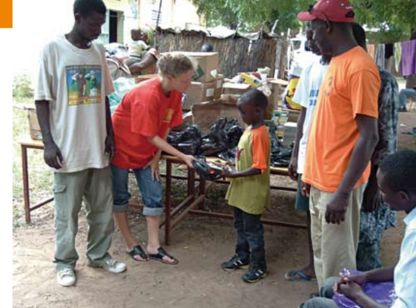
Des Rotaractiens de Montpellier remettent des fournitures scolaires à une école du Sénégal ; le financement a été réalisé grâce à des rencontres de football et des soirées.

C'est un programme parrainé par le Rotary. Tout jeune de 18 à 30 ans, étudiant ou en activité professionnelle, peut rejoindre un club Rotaract dans le but de lier des amitiés tout en faisant des actions, notamment pour les populations les plus déshéritées.