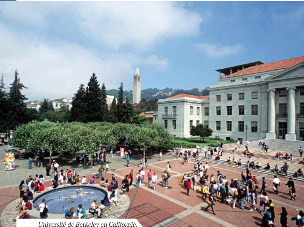
Université de Berkeley en Californie.

Le Rotary propose des bourses aux jeunes qui souhaitent entreprendre des études internationales sur les questions liées à la paix. C'est ainsi qu'ont été fondés 7 Centres du Rotary sur la paix et la résolution des conflits, en partenariat avec de prestigieuses universités.